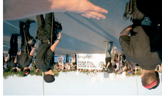
Mötena äger rum oftast på ett hotell, och övervakning med säkerhetspolis är maximal. Bilden visar demonstranter och säkerhetspolis. Sitges, Spanien.